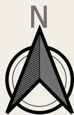
Схема сучасного використання території та схема існуючих обмежень у використанні земель М 1:1000